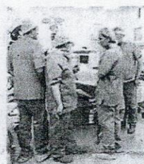
Al policlinico Intervento alla Sun

«L'intervento è praticato attraverso incisio-